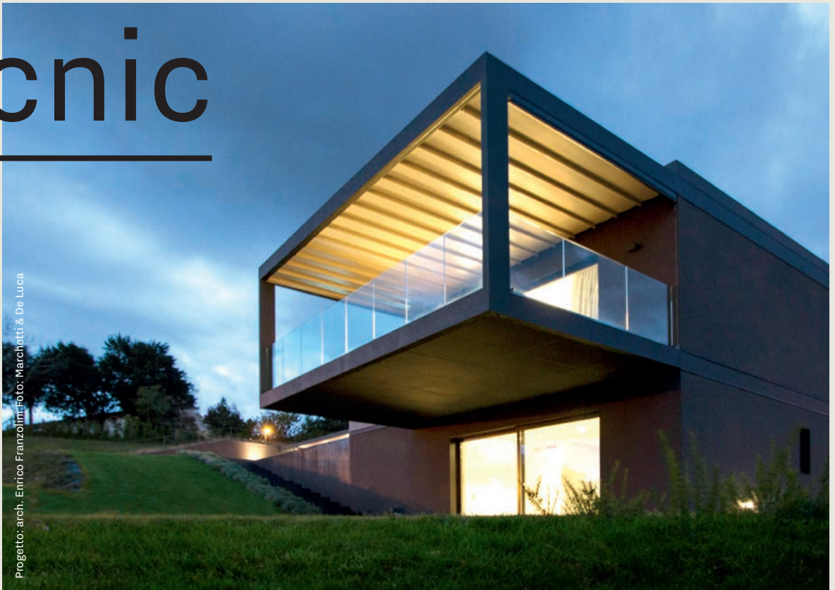
Progetto: arch. Enrico Franzoloni.

Tecnic è la copertura ideale per ogni spazio. Il meccanismo di scorrimento su guide in alluminio consente al telo, oscurante e impermeabile, di aprirsi e chiudersi ad impacchettamento proteggendo da sole, pioggia e vento.